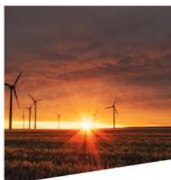
filiales vertes et écotechnologies