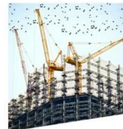
bâtiments et travaux publics