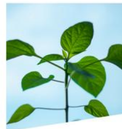
chimie verte et éco-procédés