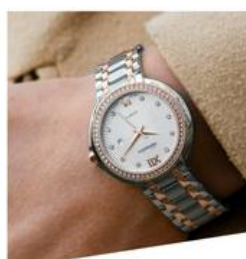
cuir, luxe, textile, métiers d'art