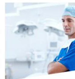
santé et bien-être