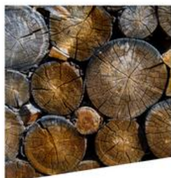
bois et industries papetières