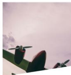
aéronautique, spatial, défense et sous-traitance mécanique